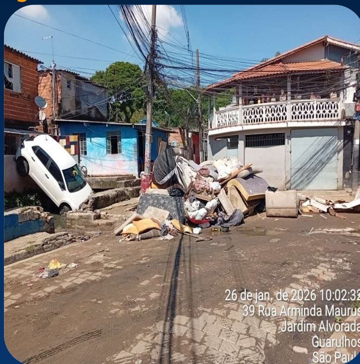
26 de jan. de 2026 10:02:32 39 Rua Arminda Maurus Jardim Alvorada Guarulhos São Paul