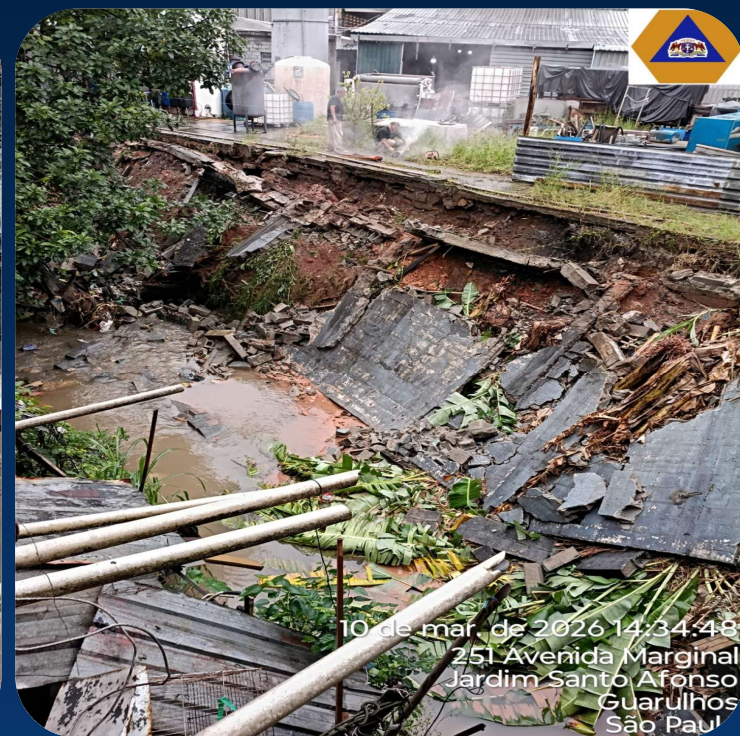
10 de mar. de 2026 14:34:48 251 Avenida Marginal Jardim Santo Afonso Guarulhos São Paul